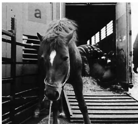
cavalli trasportati al macello

Sballottati gli uni sugli altri. Spesso senza acqua e cibo. Un viaggio-deportazione, in cui la crudeltà si mescola all'orrore.