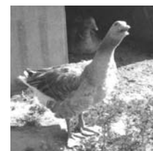
Alcuni degli animali presenti al rifugio