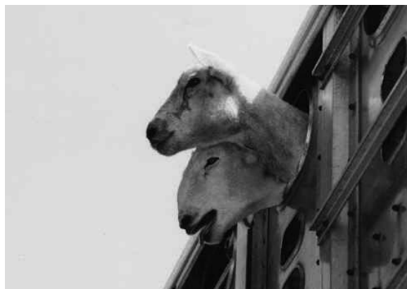
Agnelli trasportati al macello

La crudeltà a tavola è una scelta: lasciamo vivere gli agnellini, e festeggiamo la Pasqua scegliendo un menù il più possibile cruelty free.